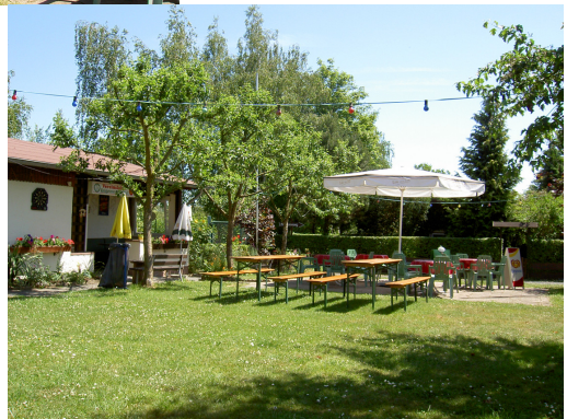
Das Vereinshaus mit dem gemütlichen Biergarten